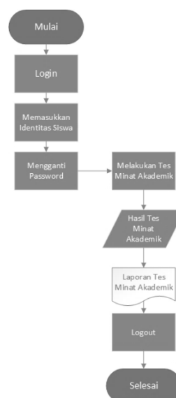
Gambar 2. Proses Aplikasi Libsys Minat Siswa

Aplikasi Libsys Minat Siswa adalah aplikasi untuk membantu siswa dalam upaya mengetahui minat akademiknya. Hasil aplikasi ini berguna bagi guru untuk mengarahkan siswanya sesuai dengan bidang yang diminati. Proses bisnis dari aplikasi Libsys Minat Siswa disajikan pada Gambar 2. Proses dimulai ketika siswa masuk kedalam aplikasi Libsys Minat Siswa dengan menggunakan username dan kata sandi yang telah diberikan oleh pihak administrator. Setelah itu, siswa memasukkan identitasnya kedalam aplikasi serta mengganti kata sandi. Siswa dapat melakukan tes minat akademik pada menu kuesioner yang ada dan melakukan tes. Hasil tes minat akademik akan keluar dan peserta didik dapat mencetak hasil tersebut, selanjutnya siswa keluar dari aplikasi. Berikut adalah bagan dari proses aplikasi Libsys Minat Siswa.